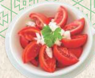
парадајз салата са луком tomato salad with onion