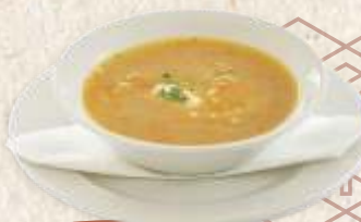
телећа чорба thick veal soup