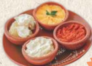
српски микс serbian mix