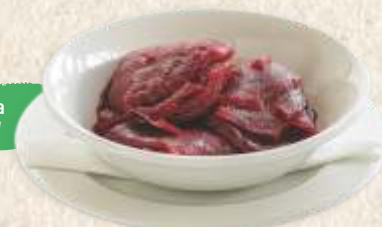
цвекла салата beetroot salad