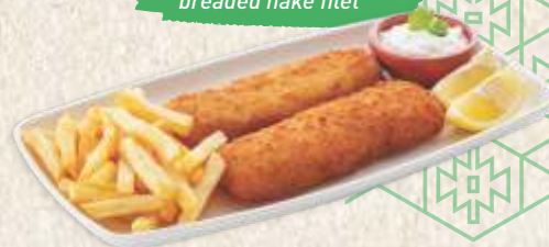
панирани ослић филети breaded hake filet