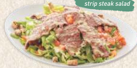
рамстек салата strip steak salad

- tomato, cucumber, pepper, red onion, olives, cheese, oregano, olive oil -