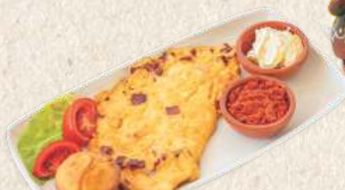
гурмански омлет са пршutom gourmet omelet with dry beef ham

Кисело млеко „Завичај“ homemade yogurt "zavičaj"