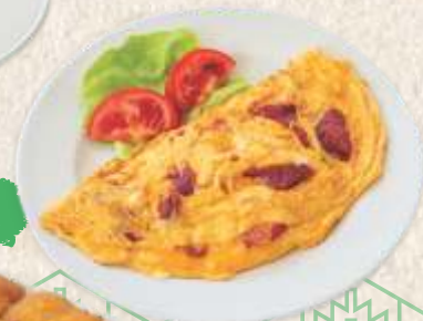
омлет са паприком omelet with red peppers