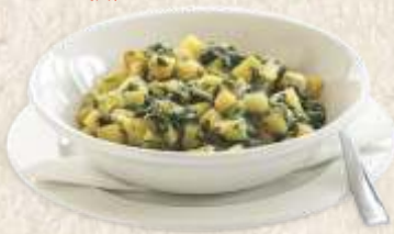
далматинско вариво cooked chard and potatoes