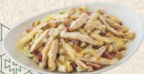
цезар салата caesar salad