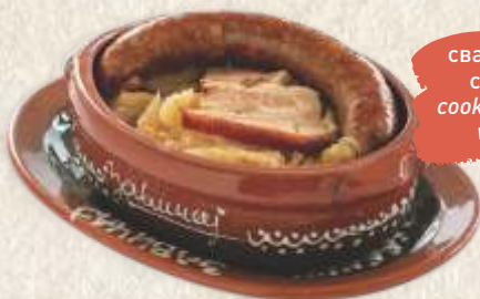
свадбарски купус са кобасицом cooked sour cabbage with sausage

* - прилог пире кромпир - * - with mashed potatoes -