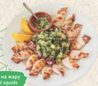
лигње на жару grilled squids