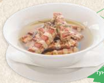
туна у ароматичном уљу tuna in aromatic oil

* - прилог далматинско вариво - * - with chard & potatoes -