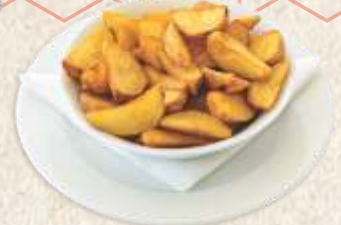
млади кромпир fried spring potatoes