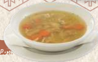
домаћа супа homemade noodle soup