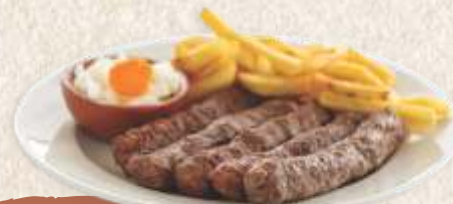
Ћевапи kebab - minced meat finger