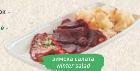
зимска салата winter salad