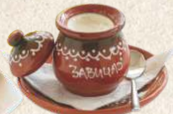
кисело млеко homemade yogurt

ДОРУЧАК се служи од 9.00 до 12.00 BREAKFAST is served from 9 am to 12 am