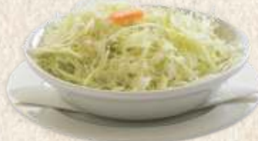
купус салата cabbage salad