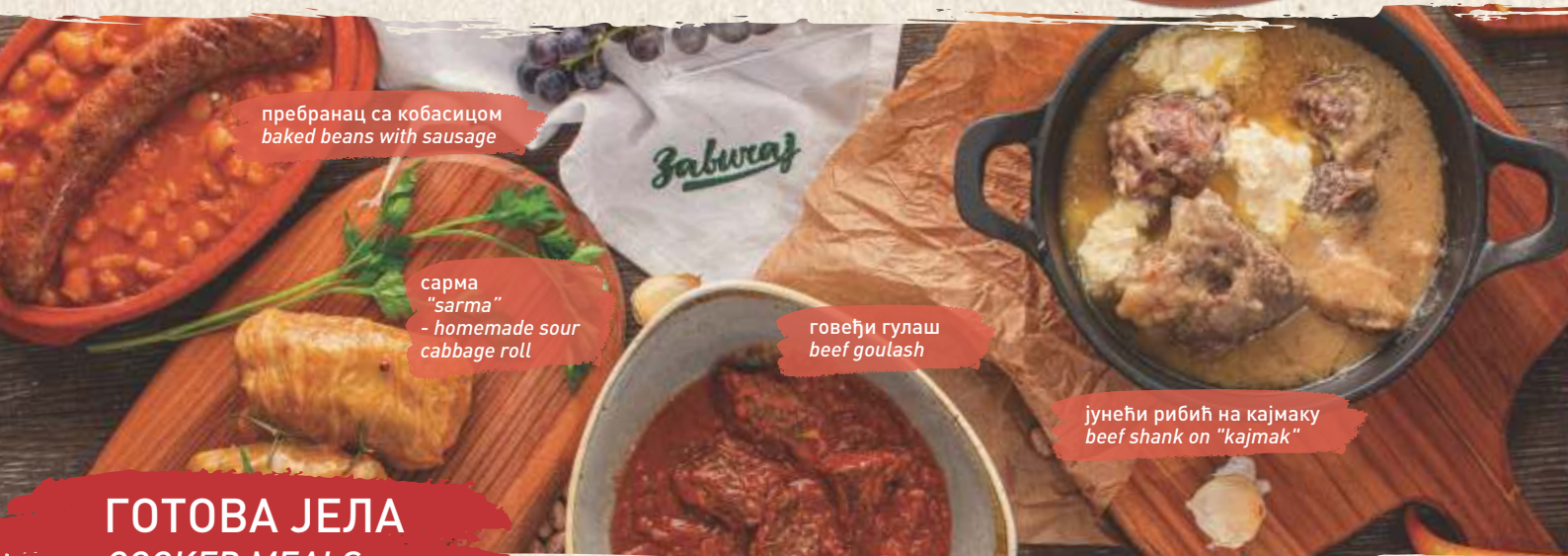
пребранац са кобасицом baked beans with sausage