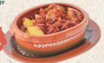
лесковачка мућкалица са свињским месом pork stew with vegetables & hot peppers