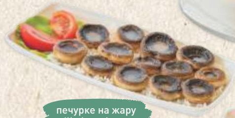
печурке на жару grilled mushrooms

рижото пилетина и поврће chicken & vegetables risotto