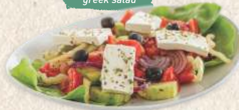
грчка салата greek salad