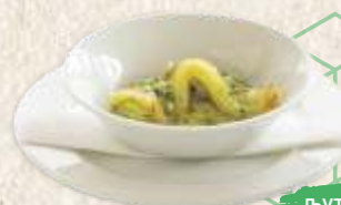
љута папричица у уљу chili pepper in oil