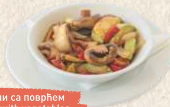
шампињони са поврћем mushrooms with vegetables