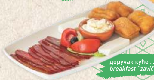
доручак куће „завичај“ breakfast "zavičaj"

традиционални доручак traditional breakfast