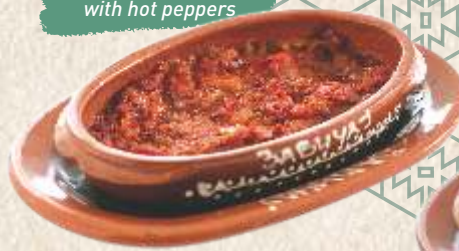
гурмански сатараш mixed vegetables stew with hot peppers