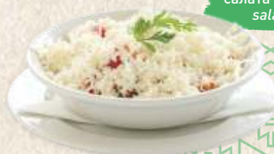
салата куће „завичај“ salad "zavičaj"