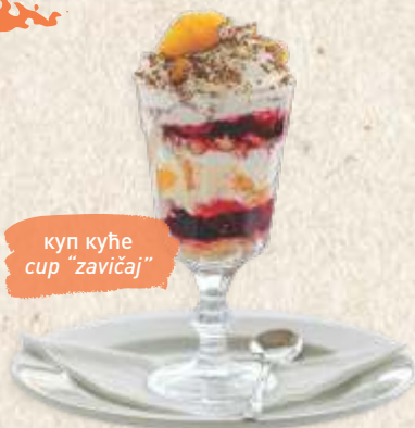
куп куће cup "zavičaj"