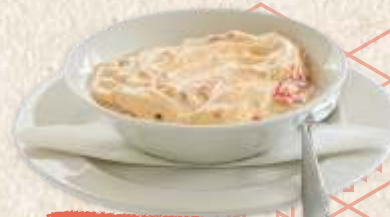
сос од цепкане паприке red pepper sauce