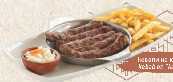
Ћевапи на кајмаку kebab on "kajmak"