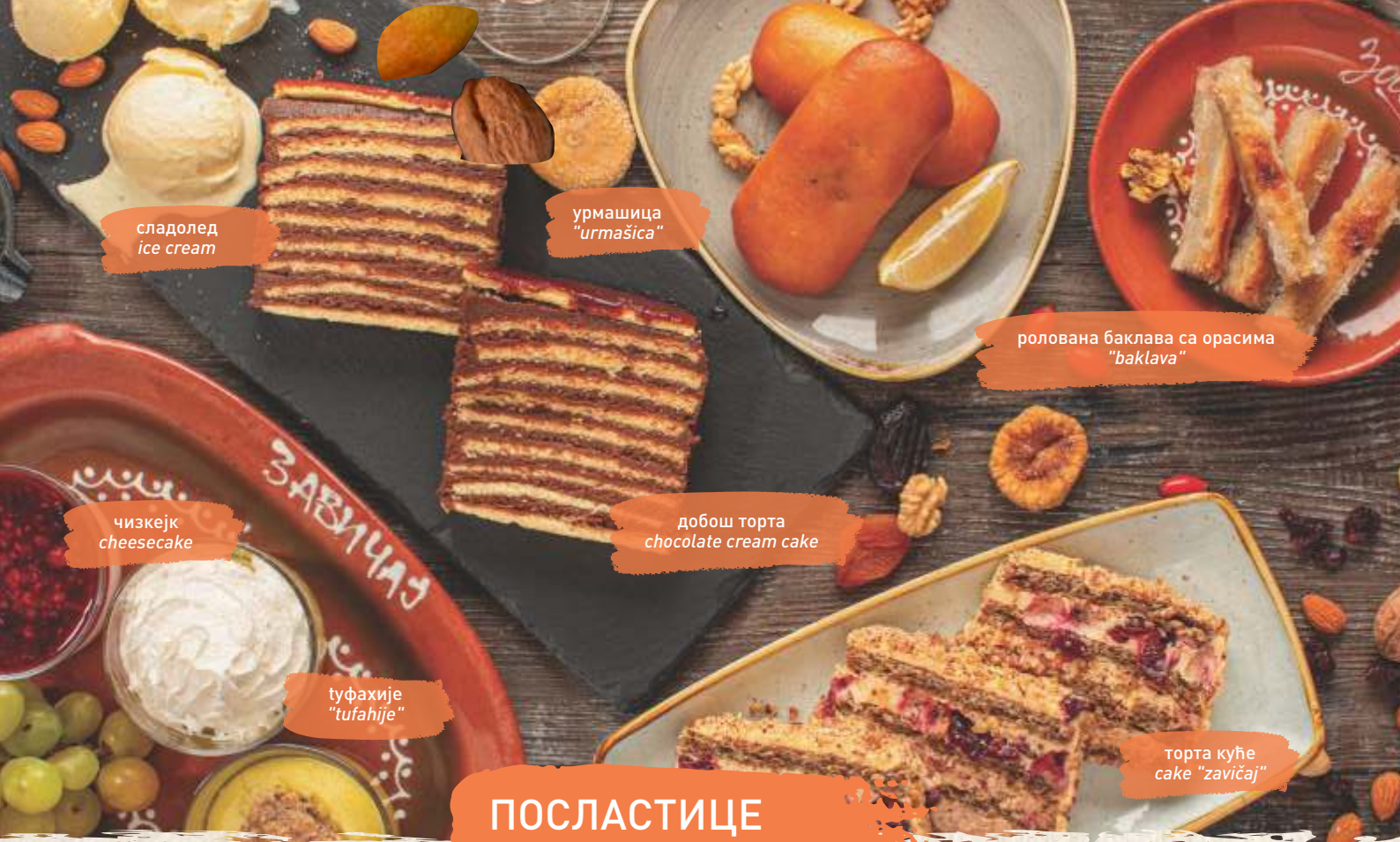
сладолед ice cream