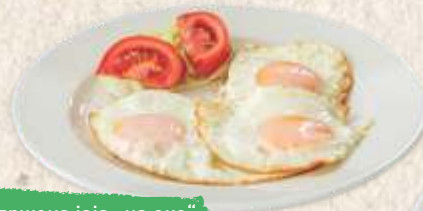
пржена јаја „на око“ fried eggs

* Прилог: ајвар, паприка у павлаци, парадајз, проја са сиром * Side dish: "ajvar", bell peppers in sour cream, tomato, Serbian corn bread with cheese