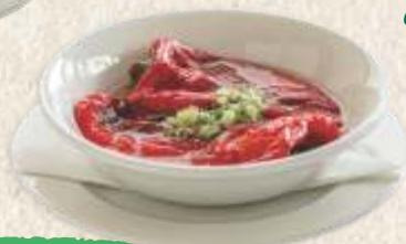
печена паприка салата baked red pepper salad