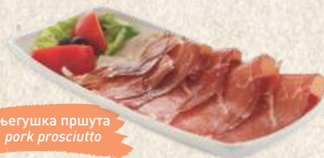
његушка пршута pork prosciutto

направите свој избор и уживајте у Завичају make your choice & enjoy zavičaj