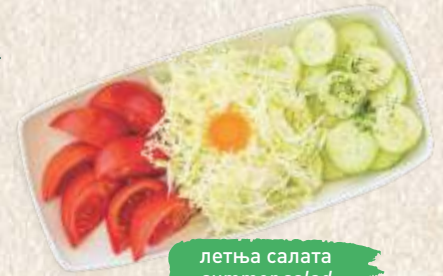
летња салата summer salad